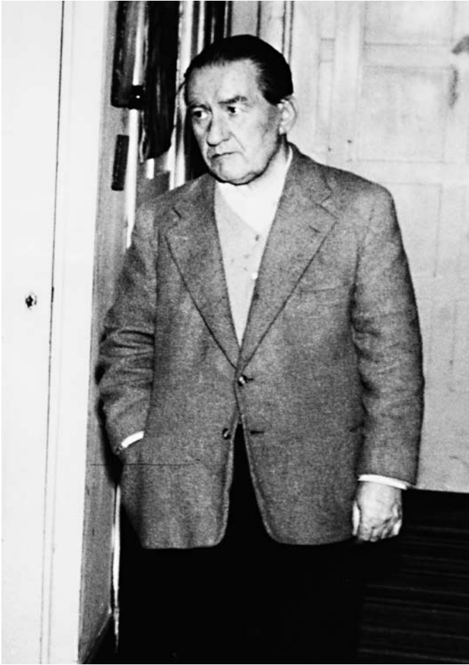
Trött gammal man.

”Han längtade efter samma gröna dalar av lycka som Kivi skrev om. Sin längtan uttryckte han i dikter och prosa där alla motsatser småningom upphörde. Språnget var slut, vilan var kvar. Kanske han anade att hans öde skulle bli lika bittert och hårt som Kivis. Jag besökte honom några gånger i Nickby, där han vistades de sista fem åren, bortom hopp om bättring. En gång åkte jag dit i sällskap med Gunnar Björling, som förtvivlad märkte att den gamle vännen inte kände igen honom. För yttervärlden