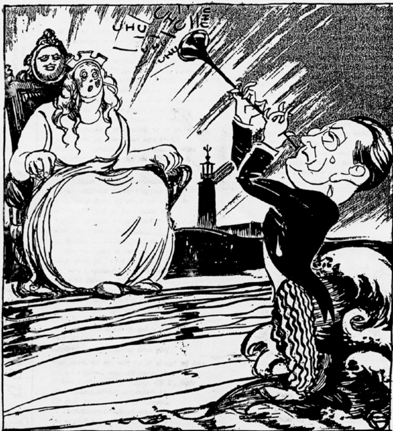
TILL SKALDEN SKRIKTONIUS.

Skalden Skriktonius, skämttidningen Garms uppfattning om vad Diktonius sysslade med.