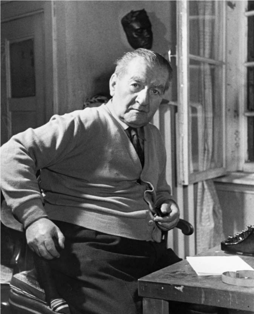
Gammal man med pipa.

Det är absurt och kanske perverst att i tecken av vad man kallar kontrafaktuell historieskrivning (vad och vem och hur skulle han varit, om ej omständigheterna gjort honom till den han blev) och i en epok av betoning på hälsa, riktiga kostvanor, friluftsliv, motion och allmän behovstillfredsställelse ge råd och förmaningar till en för länge sedan död författare.