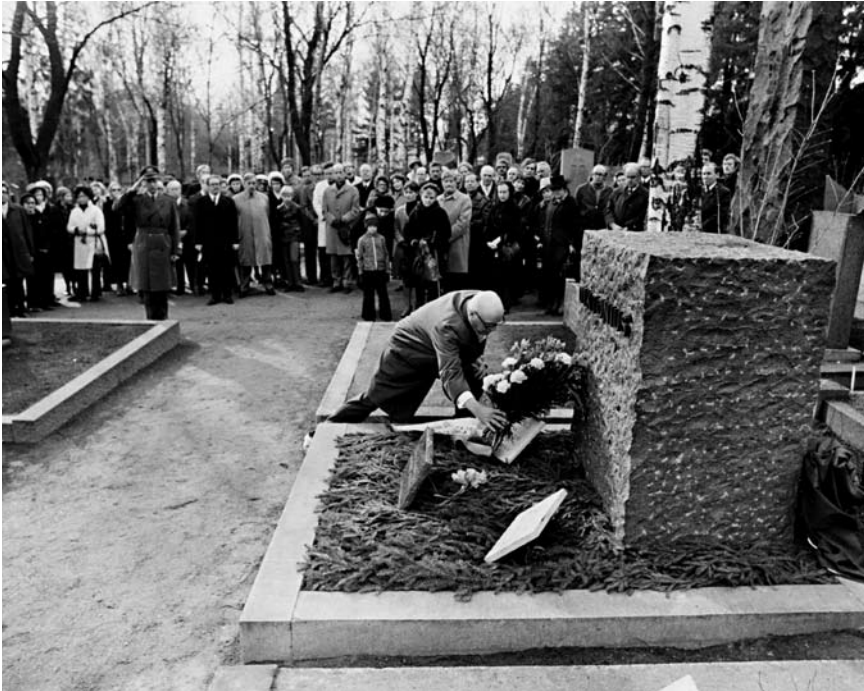
Kransnedläggning 1 maj 1973. President Kekkonen lägger ned sin bukett.

Med Kuusinen som lyckades dö en naturlig död och alla andra emigranter, som antingen mördades eller avrättades av Stalins regim förlorade Finland ett intellektuellt kapital som det vita Finland med glädje avstått från.