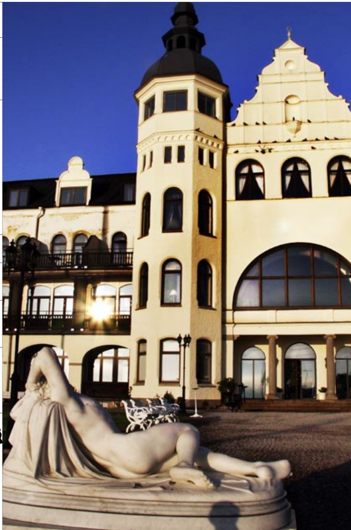
Grand Hotel Saltsjöbaden är ett storslaget bygge – men fasaden lovar mer än vad hotellet kan hålla.