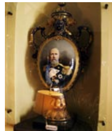
Kung Oskar II, som invigde Grand Hotel Saltsjöbaden 1893, står porträtt på en magnifik vas i lobbyn.