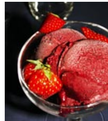
Björnbärssorbet med färska jordgubbar är en vacker och god dessert.