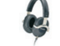
Sony Z1000 Studioreferens står det på paketet. Pris 4 000 kronor.

Riktigt perfekt lyssning när ljudkvaliteten betyder allt innebär tyvärr en djupdykning i plånboken. Vanligaste lurarna sluter om hela örat. Tänk på komforten, eller mer brutalt uttryckt: hur svettiga får öronen bli?