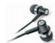
Creative EP-3NC In Eartyp. Pris 670 kronor.

För den som lyssnar mycket i bullriga miljöer eller för flygresenären som hellre vill ha sköna toner än dåån från jetmotorer i öronen är lurar med aktiv brusreducering självklara.