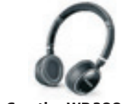
Creative WP 300 Vikbara bluetooth-lurar. Pris 800 kronor.

Sladdhataren har för länge sedan valt en trådlös modell. Den bästa kvaliteten för ljudöverföring får man med radiotekniken Kleer. Bluetooth är också vanligt men klarar inte riktigt ljud av cd-klass.