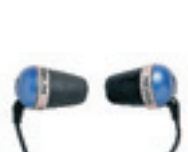
Koss The Plug Pris 125 kronor.