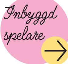
Skullcandy MP640 Double agent Har inbyggd spelare som klarar minneskort. Pris 899 kronor.