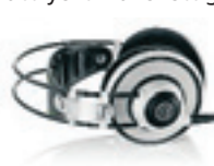
AKG Q701 Finns i grönt. Pris 4 290 kronor.