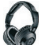
Sennheiser MM550 Trådlösa. Pris 2 650 kronor.