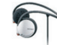
Sony MDR AS30G Svängd bygel. Pris 229 kronor.

När mp3-spelare och mobiltelefon krympt har allt fler musik i öronen. Sportlurarna ska vara små och passa under luvan i höstrusket. De har en svängd bygel som ligger i nacken eller är pluggar som trycks in i öronen.