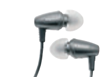
Klipsch Image S3 Pris 439 kronor.

In ear-luren, alltså proppar som trycks in i öronen, är den bästa lösningen för att få bra ljudkvalitet ur små lurar. Villkoret är att pluggarna sitter tätt i hörselgången och kan stänga ute bakgrundsbuller.