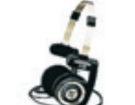
Koss Porta Pro Går att vika ihop. Pris 279 kronor.

Slutna lurar kan lätt bli för varma. De öppna modellerna med mindre öronkuddar lanserades med Sonys första Walkmanspelare runt 1980 och kom för att stanna. Numera ofta hopfällbara på olika sätt.